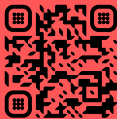
Plate-forme de ressources des Ceméa.